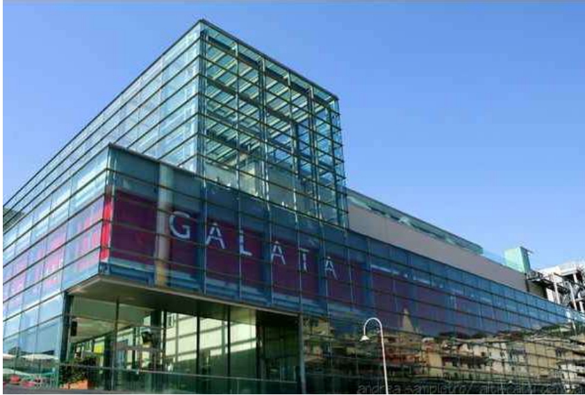
Galata Museo del Mare