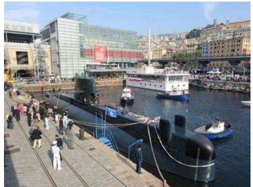
Bacino marittimo della Darsena