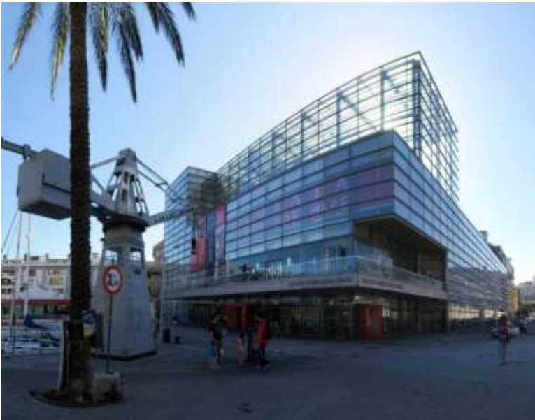
Galata Museo del Mare

Un'area di pregio, di interesse storico e culturale, restituita alla città