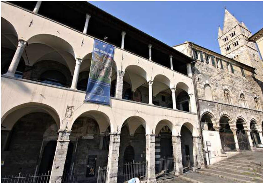
Commenda di Prè