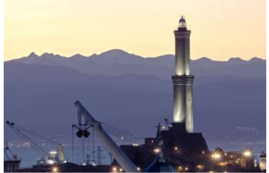
Lanterna di Genova